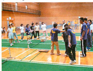
バウンドテニス 6分の1のコートで行うミニ版 テニス。