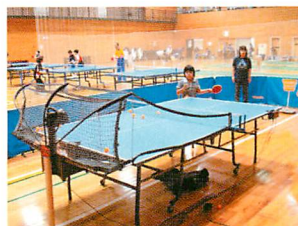
卓球 卓球マシンの体験