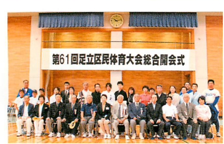
第61回足立区民体育大会総合開会式

IT時代、情報化時代の中で、「あだち体協」は紙面だけでなく、伝えることができる「温かさ」「やさしさ」を求め、体協関係の情報を発信し続けて参りました。今後、紙面をさらに充実させ、皆さんに親しまれる「あだち体協」をめざして、皆さんにH・O・Tな情報を提供して参る所存でございます。