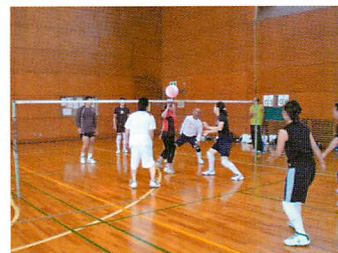
ビーチボールバレー 足立のニュースポーツとして人気です。