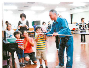
スポーツ吹き矢 安全な吹き矢。楽しみながら腹式 呼吸で健康づくり。